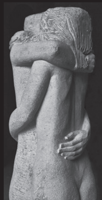
Vittorio Tavernari, Le mani (Amanti) , 1975

Associazione Amici della Badia di San Gemolo in Valganna