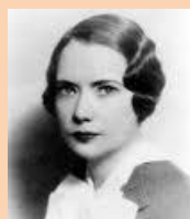
Simone De Beauvoir