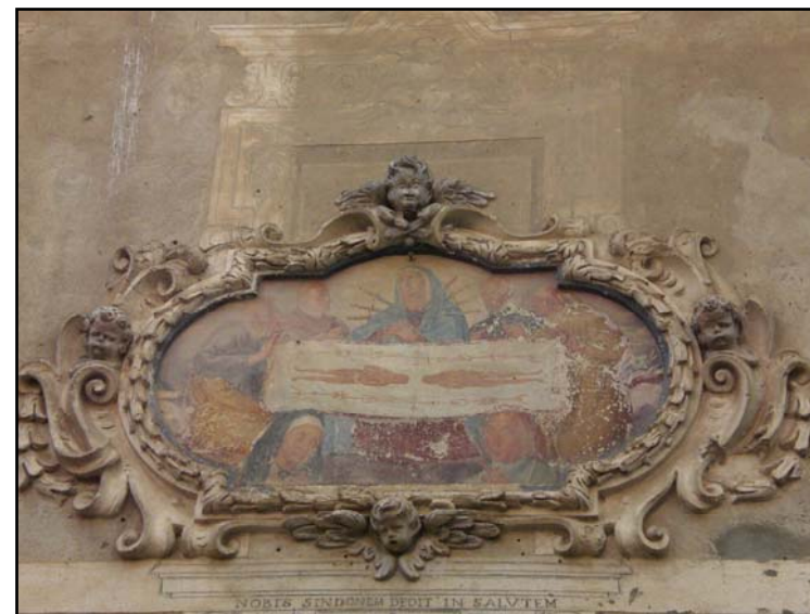
Loggio di Valsolda