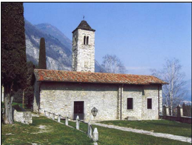
Caslino d'Erba, S. Calocero